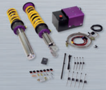
HLS Drop Kit komplett mit KW Gewindefahrwerk Complete HLS Drop Kit including KW coilover kit