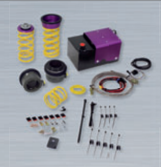
HLS Drop Kit als Nachrüstsatz für KW Dämpfer oder serienmäßige Gewindefahrwerke HLS Drop Kit conversion kit for KW or OEM coilover kits